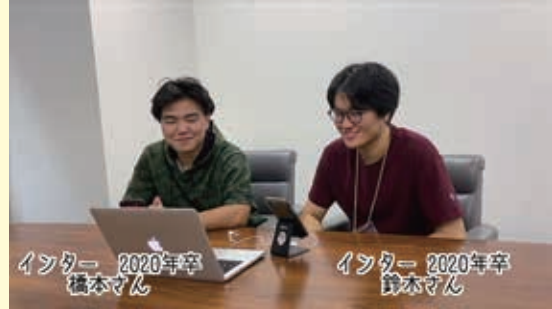
新卒学年によるオンライン企画撮影の様子