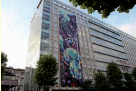
昨年のけやき祭のテーマは「研」

開催状況は学園のHP・同窓会SNSでお知らせします。または学園までお問い合わせ下さい。