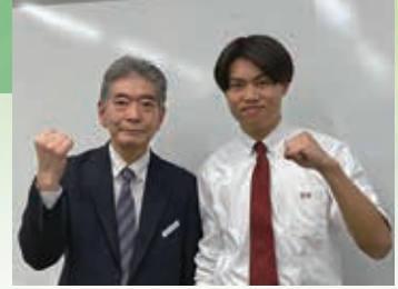
教え子とのツーショット